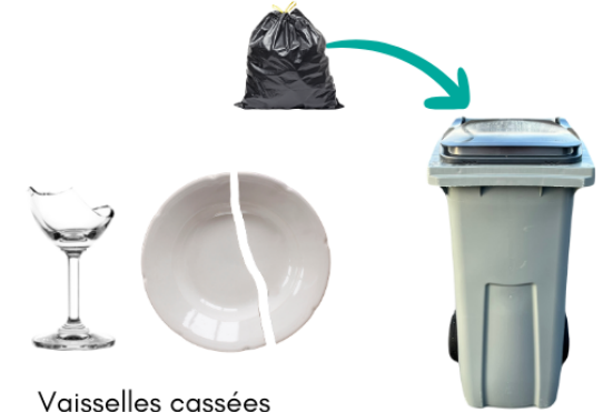
Vaisselle cassées (en petite quantité)