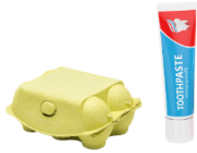
Boîtes et tubes