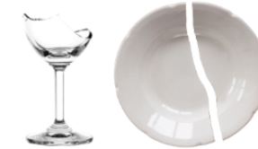
Vaisselle cassées (en petite quantité)