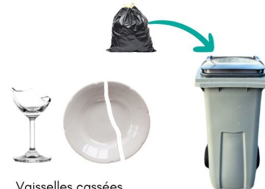
Vaisselle cassées (en petite quantité)