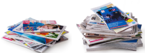
Papiers, journaux et magazines