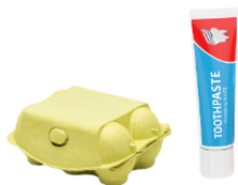
Boîtes et tubes