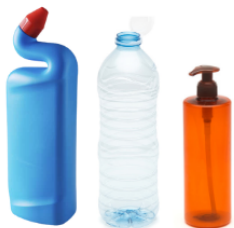
Bouteilles et flacons

Les emballages recyclables doivent être vidés, non imbriqués et déposés dans le bac (couvercle jaune).